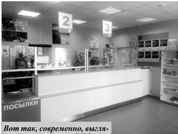
Вот так, современно, выглядит теперь здание ОПС «Воротынский».